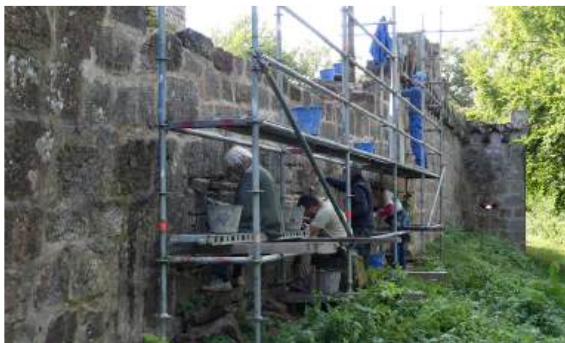
Jointement du rempart en septembre