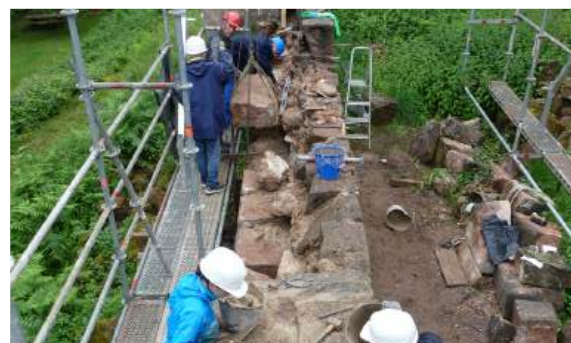
Travaux sur la courtine ouest en juin