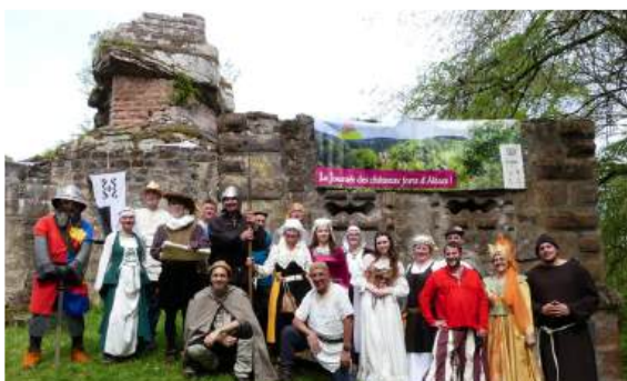
Les membres de l'association le 1 er mai