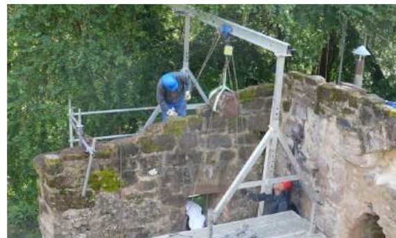
Ajout des trois blocs en octobre